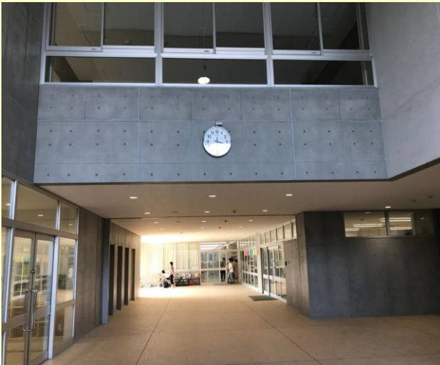
東口門のピロティ側面