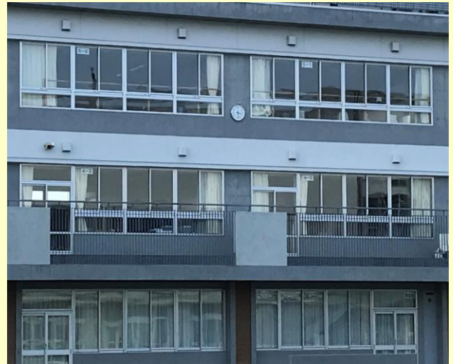
西側校舎のグランド側